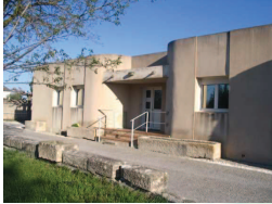
Siège social du canal de l'Isle

L'ordonnance de juillet 2004 et son décret d'application de 2006 réforment les textes de la loi de 1865 qui régissait le fonctionnement de nos structures. Ce texte énonce clairement que les Associations Syndicales sont des Etablissements Publics à Caractère Administratif. En outre, l'ordonnance élargit les pouvoirs de l'Assemblée des Propriétaires et confirme le principe de périmètre syndical. Les notaires auront ainsi obligation d'informer les nouveaux propriétaires de l'appartenance de la parcelle au périmètre syndical. Cette mesure officielle aura le mérite d'éviter bien des malentendus.