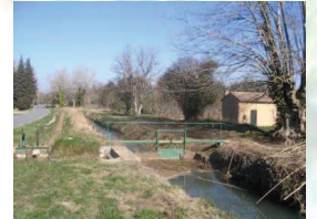
Transversale qui permet d'assurer la régulation du canal

En juin 2010, une demande de financements a été faite pour une étude de régulation sur le canal maître. L'Agence de l'Eau, le Conseil Général et le Conseil Régional ont été sollicités pour cette étude. Elle permettra un état des lieux et un diagnostic du dispositif de régulation actuel.