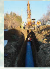
Pose de canalisation Ø 600 mm

Ces travaux permettront aussi, même si ce n'est pas un usage garanti par le canal, de faire de la lutte antigel. Enfin, dans un contexte climatique changeant, n'oublions pas que la mise sous pression du réseau existant, permet de n'apporter que le strict volume d'eau nécessaire à la parcelle. Cela constitue une source non négligeable d'économies d'eau sur le territoire. La modernisation du secteur de l'Arrousaire est prévue pour se poursuivre sur au moins 7 ans, la suite au prochain bulletin !