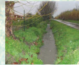
Filiole du canal lors d'une pluie