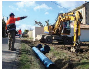
Préparation au creusement de la tranchée

Près de 50 ha jusqu'alors desservis gravitairement ont été modernisés. Les travaux entamés en janvier 2010 ont permis d'apporter de l'eau sous pression aux agriculteurs exploitant des terres sur mais également à des usagers particuliers de ce secteur situé au croisement de la route d'Apt et du chemin des balades, entre les communes de Lagnes et l'Isle sur Sorgue.